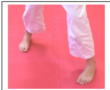
Sanchin dachi (petit sablier)