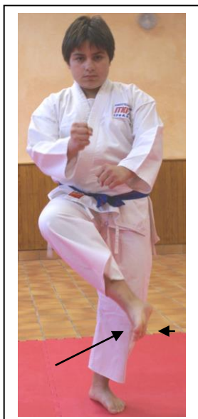
Nami Ashi barai