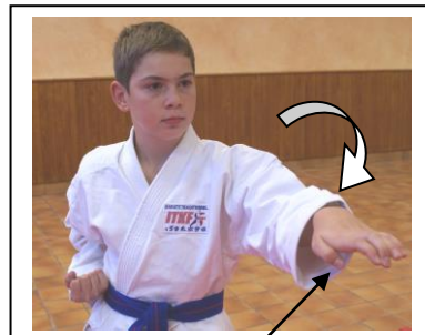
Haïto uchi/ Uke